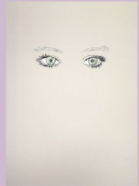
3 © Adagp, Paris