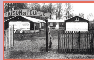
1 Les baraquements de la Maison du Peuple en 1924.

Infos et actualités : https://www.facebook.com/collectifdesbrestoises #collectifdesbrestoisespourlesdroitsdesfemmes