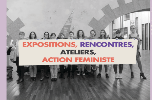
6 Le Collectif des brestoises pour les droits des femmes, atelier chant aux Capucins, 23 février 2020.

Maison du Peuple Salle des Syndicats Esplanade Cesaria Evora